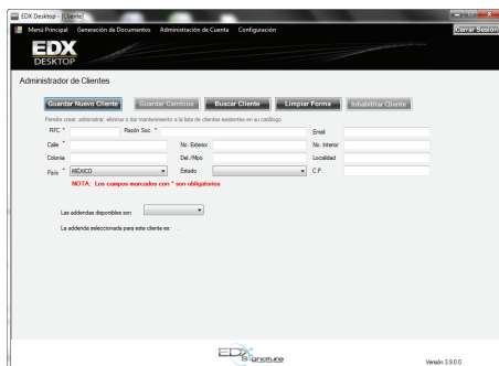
Administración de Productos y Clientes