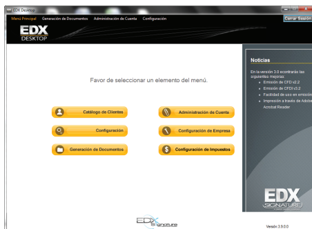
Menú principal de EDX Desktop

EDX Desktop es una solución de Facturación Electrónica diseñada para empresas pequeñas o medianas que requieran la generación de documentos electrónicos (CFD,CFDI) de forma manual, esta solución cuenta con todo lo necesario para ayudarnos en la tarea de llevar al día la facturación de la empresa.